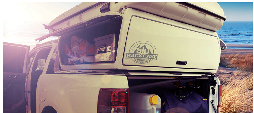
Une cellule qui s'inspire de votre pick-up et épouse parfaitement ses formes !

Pour de plus amples renseignements à propos de cette technologie de numérisation 3D vous pouvez visiter notre partenaire : www.artec3d.com