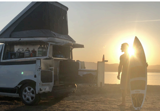
Une cellule qui s'adapte à votre passion !

Quel que soit votre pick-up, ALUBACKCASE vous propose aussi une cellule standard aux dimensions variables. Exemple avec un pick-up Dacia Docker !